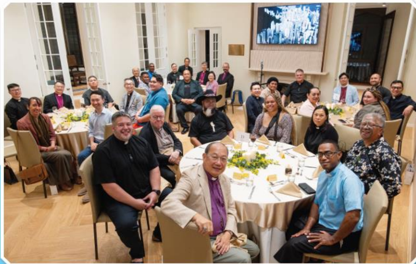
▲ 香港聖公會教省在主教府設宴款待新西蘭訪問團