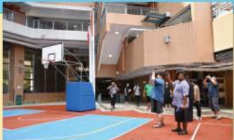
▲ 大家都欣賞聖雅各小學的校舍及整個建築群設計