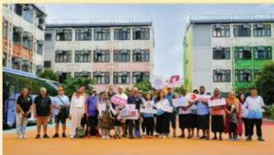
▲ 到訪德漢性房屋項目同心村