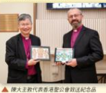
▲ 陳大主教代表香港聖公會致送紀念品予新西蘭聖公會