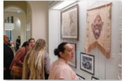
▲ 訪問團成員參觀主教府內展示的文物