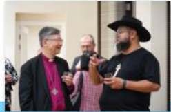
▲ 陳大主教與新西蘭的牧者首領致辭