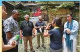
▲ 部分成員到聖雅各編群會的保育項目監屋參觀