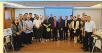
▲ 訪問團成員分組參與三個教區的牧師會，圖為香港聖雅各牧師會