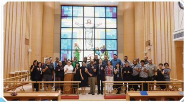
▲ 到訪聖雅各的堂校社服務單位